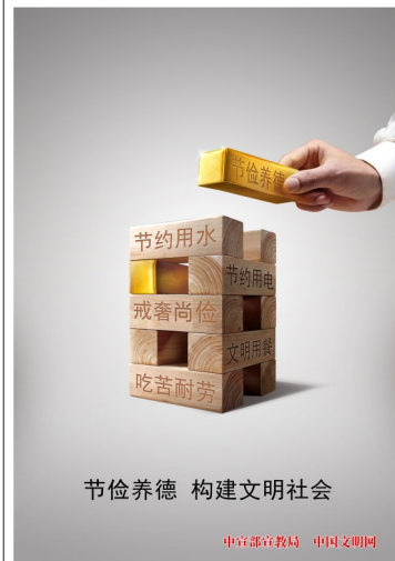
节俭养德 构建文明社会