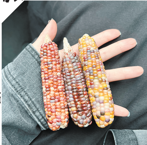
市民购买的文玩玉米毛料