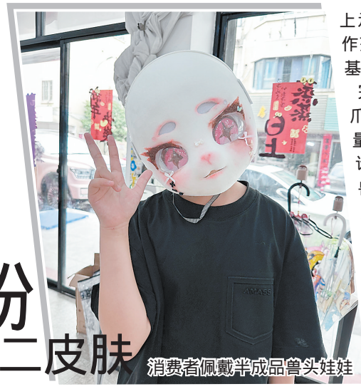
消费者佩戴半成品兽头娃娃

在工作台一旁的展示架上,摆放着一些小学员的半成品:有的兽头娃娃看上去威风凛凛,有的兽头娃娃装饰着粉色腮红和红色蝴蝶结,还有的兽头娃娃点缀着中式古风元素,每个作品都带着创作者的喜好和个性。