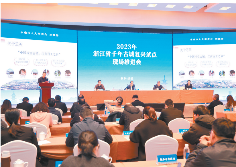
省千年古城复兴试点现场推进会

接下来,芝英镇将继续加大古城保护和发展工作力度,加快补齐发展短板,聚力提升公共服务能力,打造一核二环三入口,深耕八张金名片,做好古城文化传承活化,深化业态植入,推进古城场景多元发展,坚持以游兴城,助力古城文旅出彩出圈。