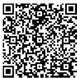
请用手机扫描二维码下载

3.回到“掌上永康”客户端首页,点击下图红框处“企业需求信息登记”栏目,即可进行信息登记。