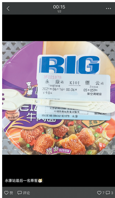
最后一名旅客晒出的朋友圈

最后一位买了车票的旅客特意取了最后一列车的纸质报销车票，配上泡面火腿肠，一张很有年代感的照片就出现在了朋友圈。