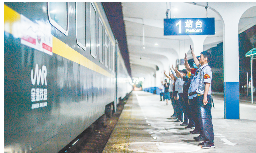
永康站工作人员挥手告别当晚最后一趟经过的列车

16日0时36分，K101次客运列车穿破黑夜风尘仆仆地驶进永康站。这列从北京驶来的普速列车，因为车次时间提前，代替K1395成为途经永康站的最后一趟列车。