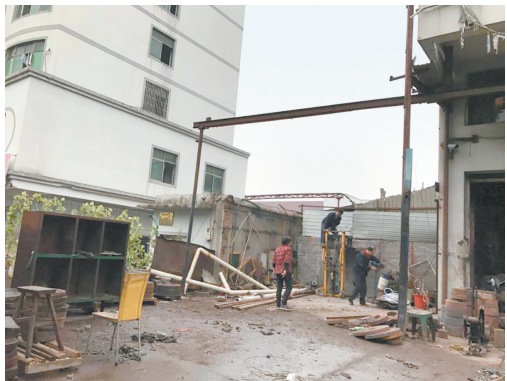
企业自拆违章搭建