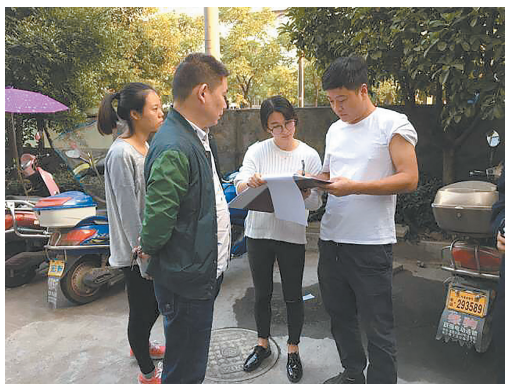
发放限期拆除通知书