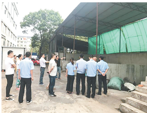
摸排企业违章情况

下一步,开发区还将继续牢牢抓住“三改一拆”这个倒逼转型发展的突破口,拆违先行,拆改结合,撬动开发区转型升级、产城融合巨变。